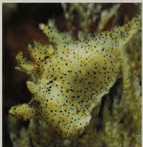
Lámina 2.- A. Aegires sublaevis ; B. Tambja ceutae y su puesta; C. Limacia clavigera ; D. Polycera quadrilineata ; E. Polycera elegans ; F. Thecacera pennigera .